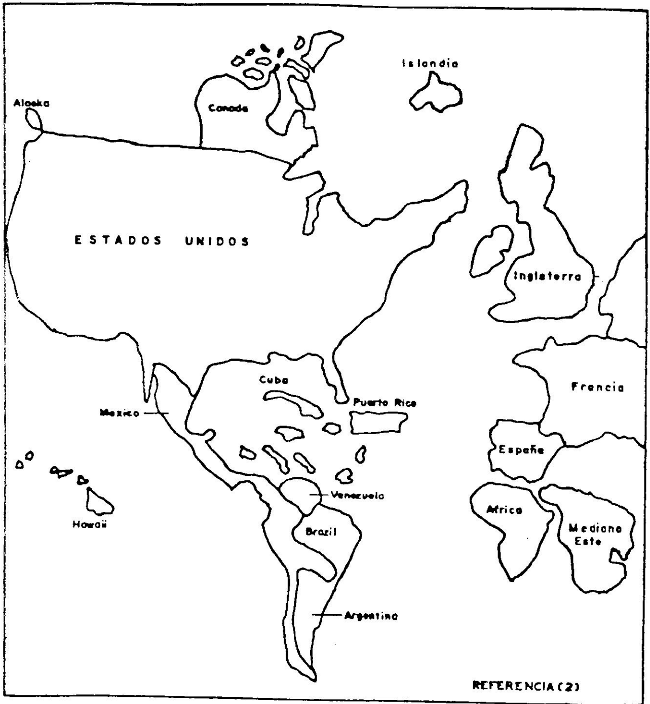
TAMAÑO DE PAÍSES EN PROPORCIÓN A SU CONSUMO DE PETRÓLEO